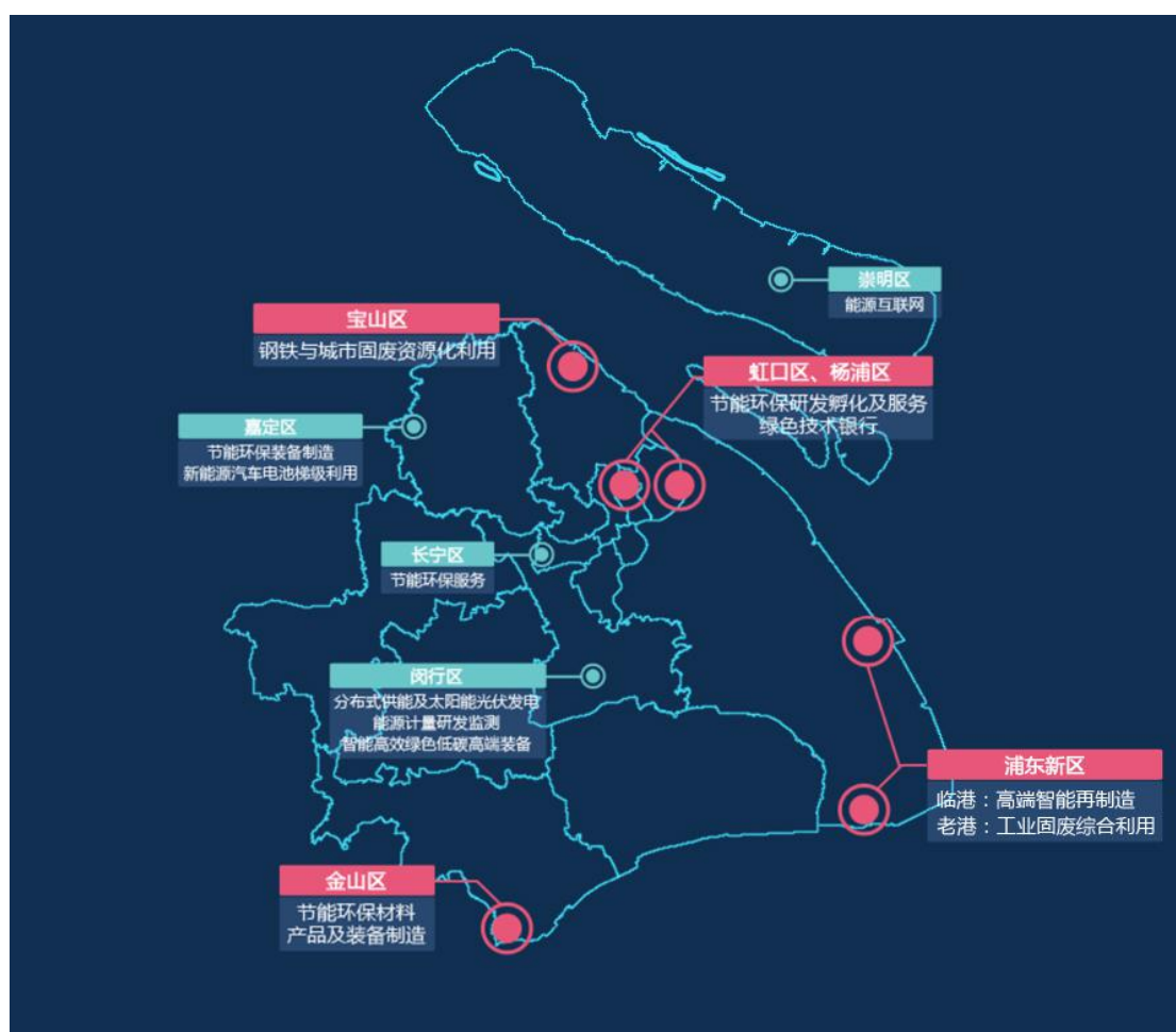
图 1-1 节能环保产业规划图